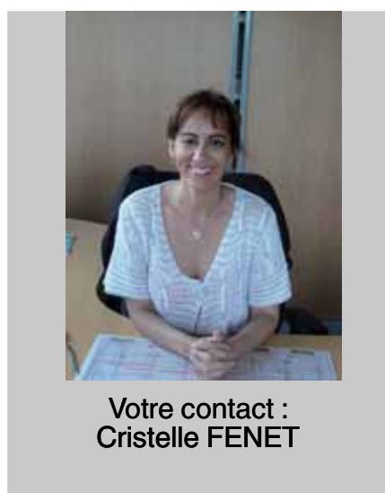
Votre contact : Cristelle FENET